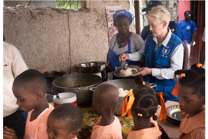
La Directora Ejecutiva del WFP Cindy McCain, en Haití

que eso cambiará. Lo que tal vez sí cambió, y agrava las cosas, es el nivel de conciencia y conocimiento que la humanidad en su conjunto tiene respecto a las causas y consecuencias de estas tres crisis, profundamente interrelacionadas. Y detrás de todas -o sería más preciso decir por encima de todas- aparece un factor común a cualquier explicación: la debilidad de la gobernanza global.