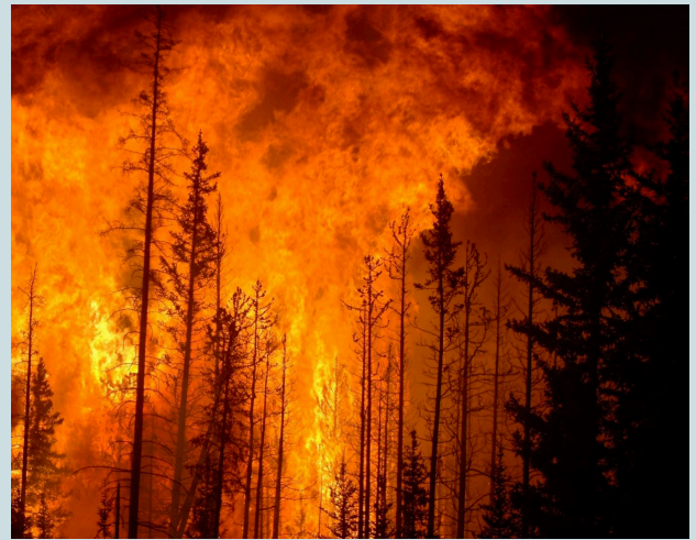
Incendios forestales en Canadá

respecto a su principal rival. La secretaria del Tesoro, Janet Yellen, siguió al secretario de Estado Antony Blinken, y precedió al enviado especial del presidente Joe Biden para el clima, John Kerry, en el desfile de dignatarios estadounidenses que llegaron a Pekín este año. El objetivo de las dos potencias: “estabilizar” sus relaciones. Dicho de otro modo, darle algo de predictibilidad a una pulseada por el poder y la influencia globales que distrae la atención de algunos de los problemas más acuciantes que enfrenta la humanidad. Son pasos, apenas. Pero viniendo de potencias rivales con profunda capacidad de influir en el rumbo que tome la política global, son buenas señales para un mundo que busca desesperadamente razones para el optimismo. ●